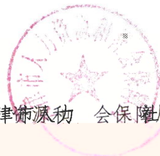
天津市人力资源和社会保障局