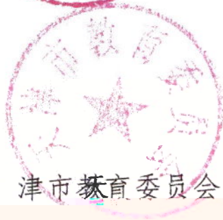
天津市教育委员会